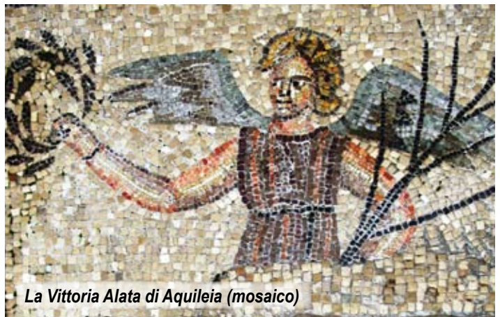
La Vittoria Alata di Aquileia (mosaico)

9 domenica Solenne consacrazione della Chiesa dedicata a San Michele Arcangelo a Bazreche (Etiopia).