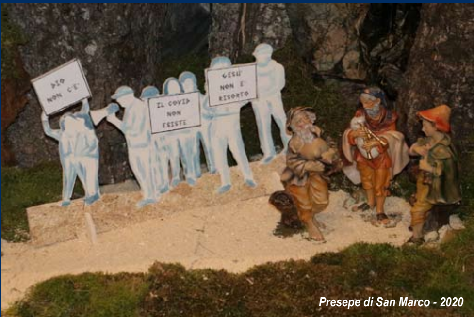
Presepe di San Marco - 2020

Cosa sta succedendo? Tante persone hanno abbandonato il percorso cristiano oppure è la Chiesa che ha abbandonato tante persone?