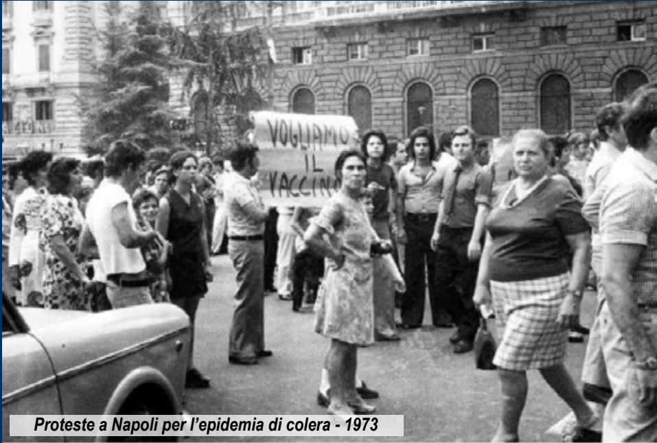
Proteste a Napoli per l'epidemia di colera - 1973

Papa Francesco si è espresso in diverse occasioni sul vaccino, in particolare il 18 agosto ha lanciato un videomessaggio ai popoli su questo argomento: