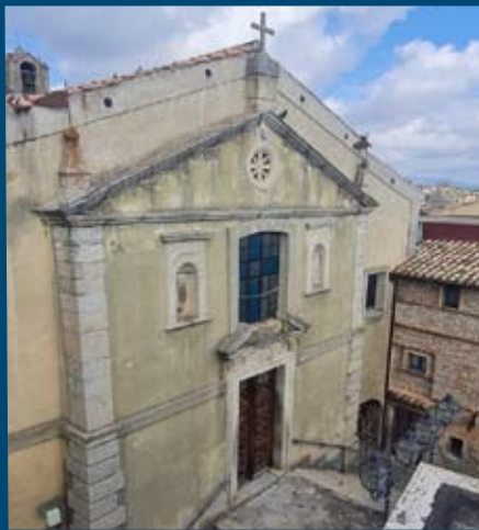
Chiesa di Camini